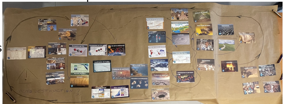
Fresque du climat

• Comment ? Discussions du Groupe de Reflexion pour une Réduction de notre Empreinte Ecologique (GRREE) ; Utilisation de l'outil GES Labos1point5