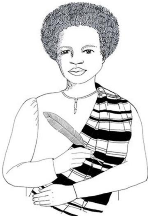
Imagem 6: Ilustração de Esperança Garcia