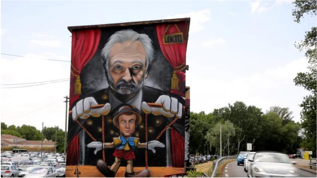
Avignon Juin 2022