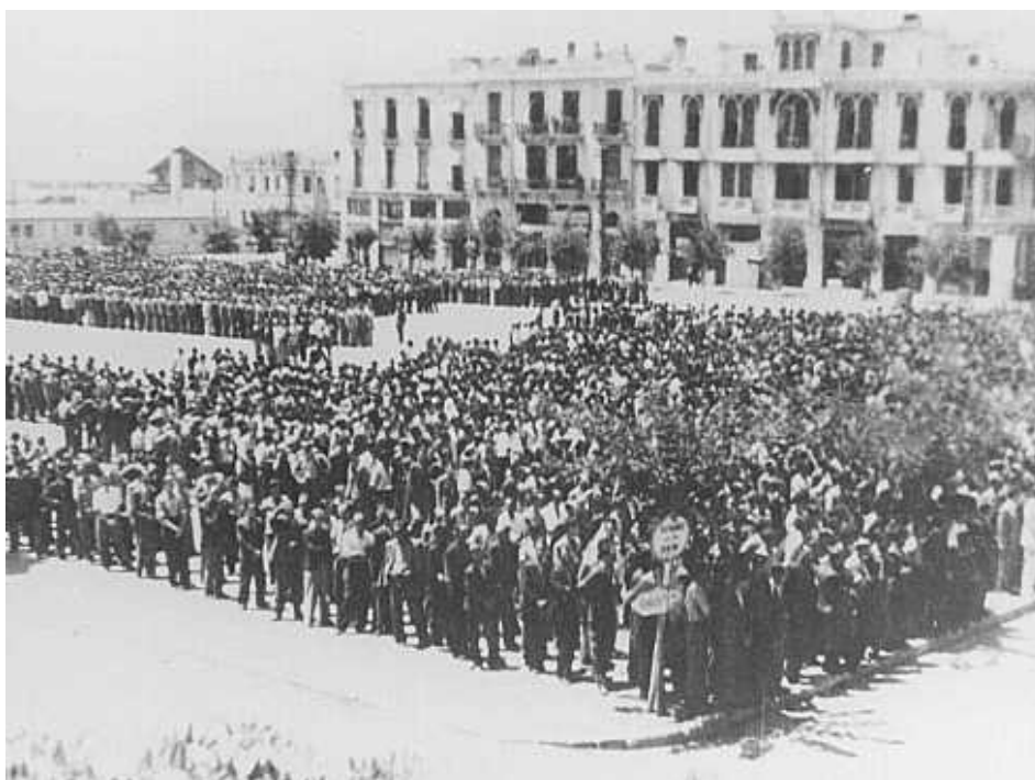
26. BUGARSKE VLASTI OKUPLJAJU JEVREJE U OKUPIRANOJ MAKEDONIJI

https://encyclopedia.ushmm.org/content/en/photo/bulgarian-authorities-round-up-jews-in-occupied-macedonia